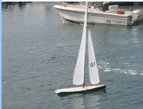
Voile Radio Commandée