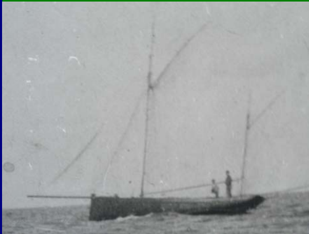
Le Gareilly, 1900

Merci à toute personne qui possède des renseignements de prendre contact au 06 08 01 74 77