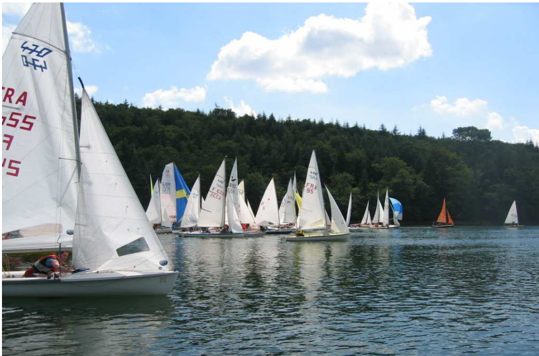
Le Départ des Dériveurs à Porz-Meillou