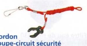
Cordon coupe-circuit sécurisé