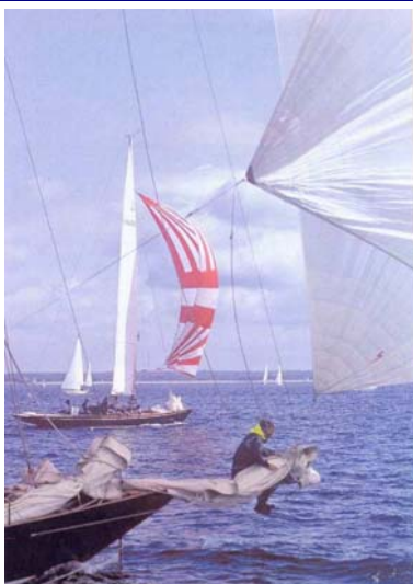
Pen Duck & Ithabella - RVV BP 2008