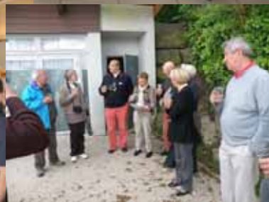
Le Jury délibère sur

La qualité des poèmes La tenue des équipages, La décoration des bateaux