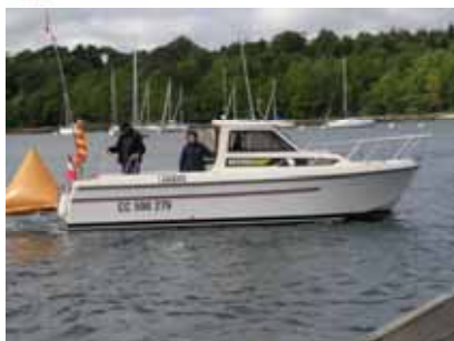
Le navire " Comité " Deux pirates aux services de sa " Majesté "

Avec la participation de la Biscuiterie Filet Bleu